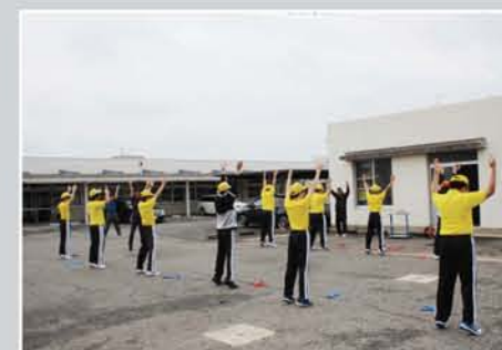
運動・体力づくりの風景