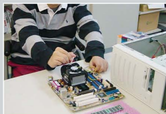
PCセットアップ実習

※ 原則として、阪神7市1町(尼崎、西宮、芦屋、伊丹、宝塚、川西、三田の各市と猪名川町)に在住の方が対象。